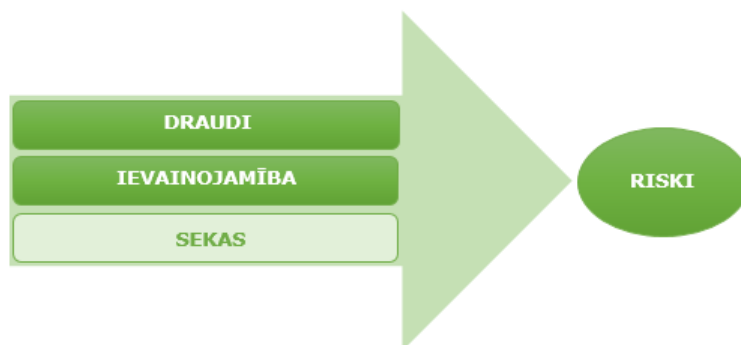
Attēls Nr. 1 Draudu, ievainojamības un seku 8 mijiedarbība